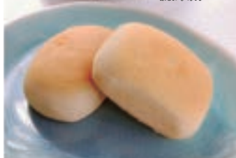
Mini cake à l'ananas 鳳梨酥

Mini cake à l'ananas 鳳梨酥 2€60 Mini cake sablé fourré à l'ananas confit. (2 pièces—份2個)