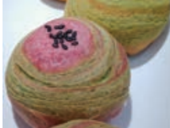
Gâteau traditionnel 雲彩酥

1 pièce 一份1個 口味任選 Taro 芋頭酥 Haricot rouge 紅豆酥 Patate douce 地瓜酥