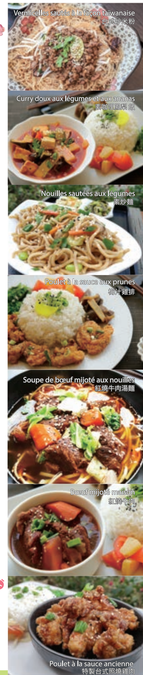
Vermicelles sautés à la façon taïwanaise 台式炒米粉