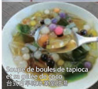
Soupe de boules de tapioca et sa gelée de coco 台式古早味冰菓室甜湯