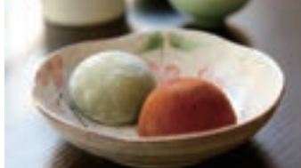
Mochi au choix 麻糬

2 pièces 一份2個 口味任選 Pâte de riz fourrée aux haricots rouges et thé vert 抹茶紅豆麻糬 Pâte de riz fourrée au parfum chocolat 巧克力麻糬