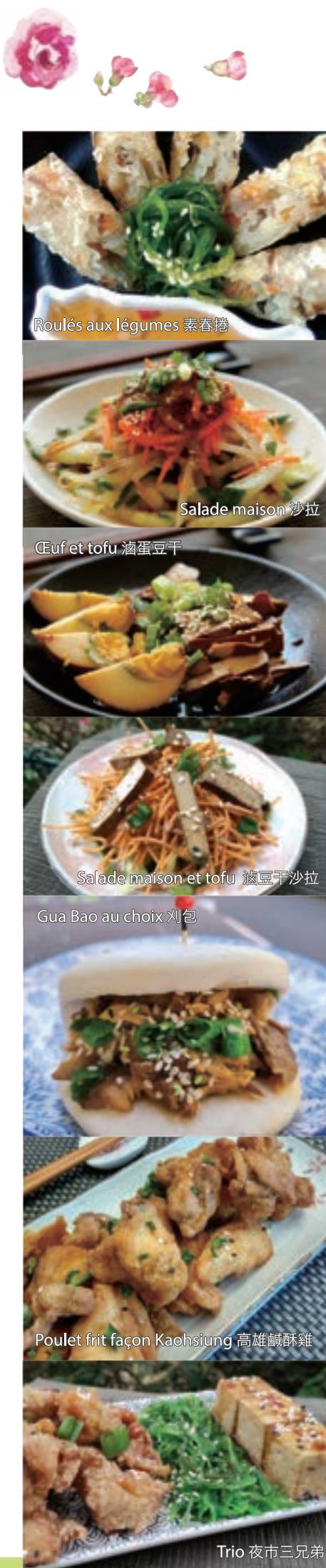
Roulés aux légumes 素春捲