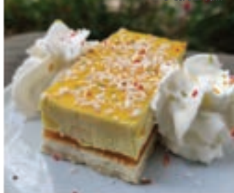
Gâteau Duo 雙拼蛋糕

Parfum spécial au choix 特殊口味任選 +1€ mangue 芒果 kumquat citron 金桔檸檬 passion 百香果 courge d'hiver 冬瓜