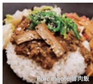
Porc mijoté 魯肉飯